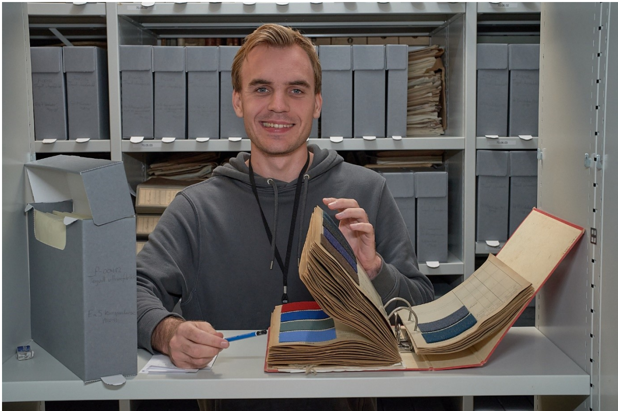
Emil Stokkevåg har ordnet arkivene i dette prosjektet.