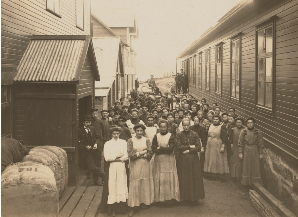
Arbeidsstokken ved Tingvoll Ullvarefabrikk, udatert.