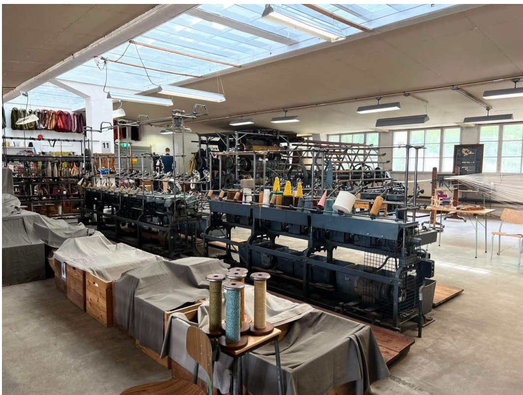
Fra Sjølingstad Ullvarefabrikk i Mandal.