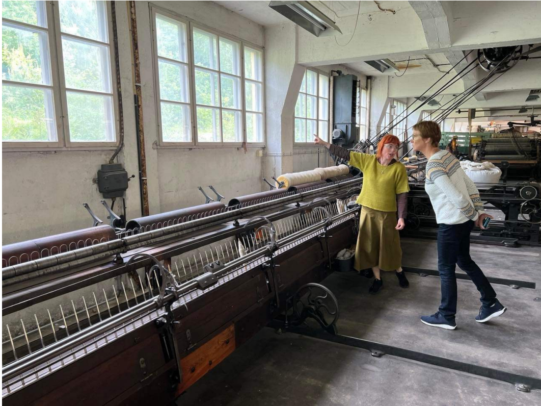
Fra Sjølingstad Ullvarefabrikk i Mandal.