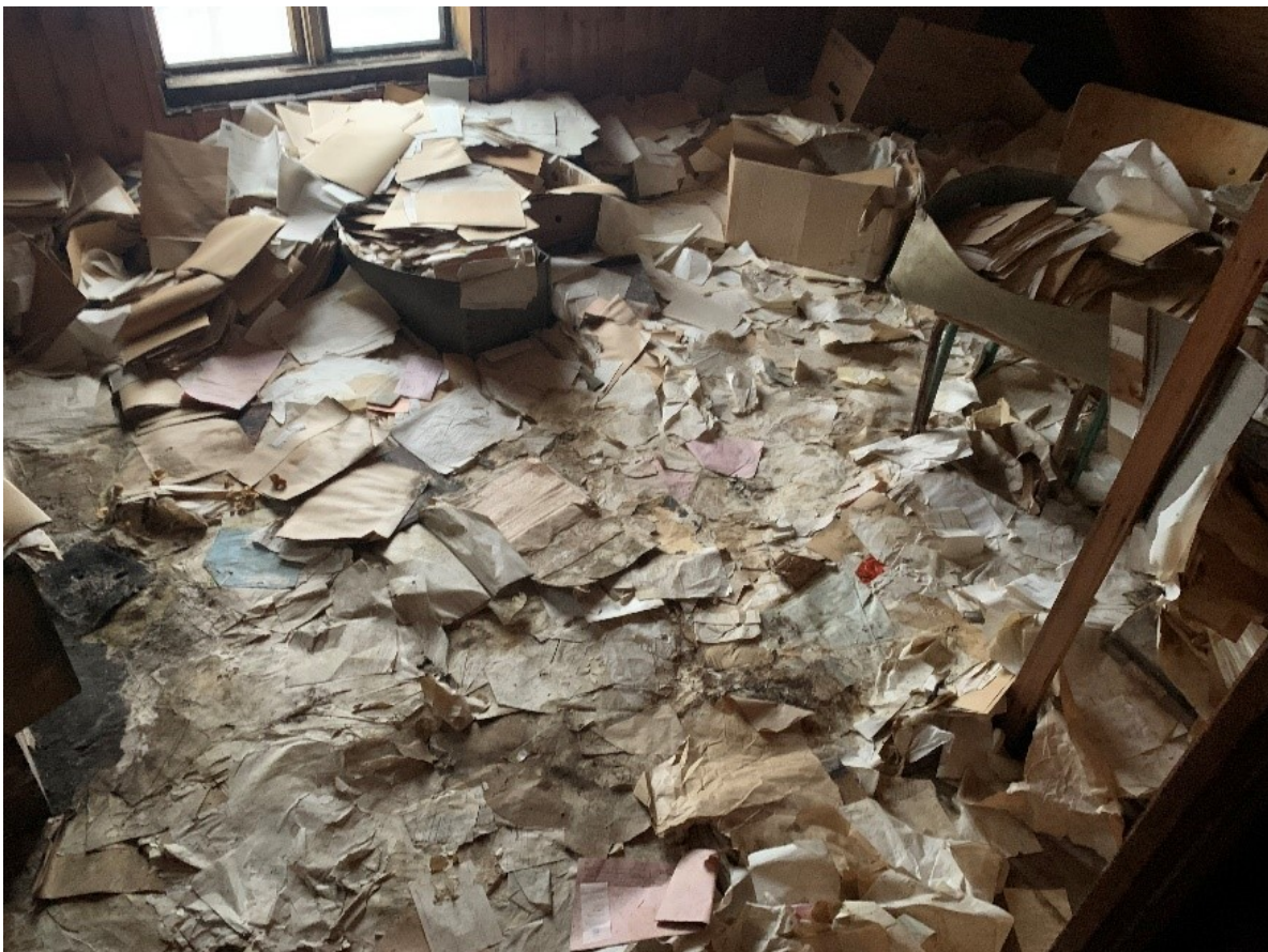
Fra Tingvoll Ullvarefabrikks tidligere administrasjonsbygg.