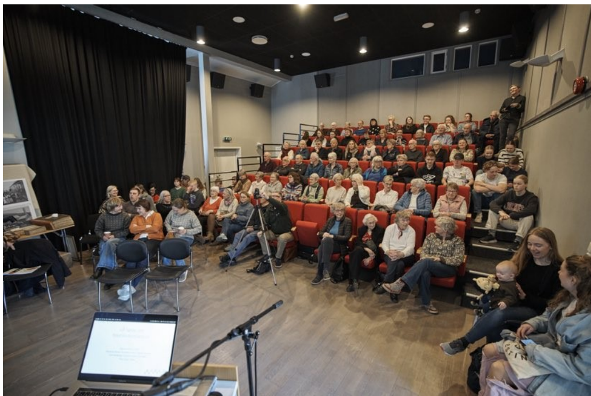
Foredrag ved Tingvoll Fjordhotell.