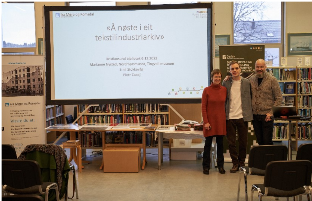
Foredrag ved Kristiansund bibliotek.